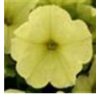
Lime Green Improved