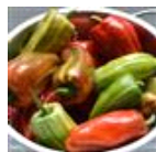
Candy Cane Red