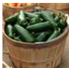
La Bomba II