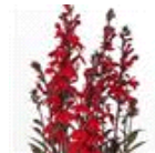
Scarlet Bronze Leaf