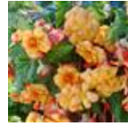
Yellow Red Picotee