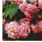
White Pink Picotee