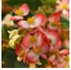
Bicolor Red White