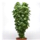
Everleaf Thai Towers