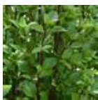
Everleaf Thai Towers