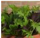
Pro San Mixture