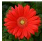
Red with Light Eye