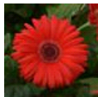
Red with Dark Eye