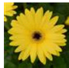
Yellow with Dark Eye