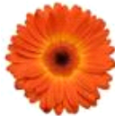
Bicolor Yellow Orange