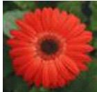
Red with Dark Eye