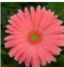
Salmon Shades with Light Eye