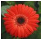
Red with Dark Eye