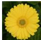
Yellow with Light Eye