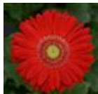
Red with Light Eye