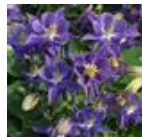
Early Sky Blue