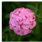
Deep Pink Maxine