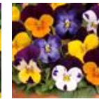
Jump Up Mixture