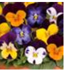
Jump Up Mixture