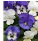
Blueberry Sundae Mixture