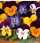
Jump Up Mixture