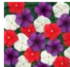
American Pie Mixture