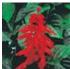
Red Hot Sally II