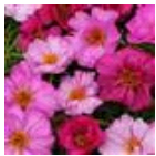
Pink Passion Mixture