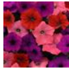
South Beach Mixture