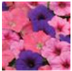
Beachcomber Mixture Improved