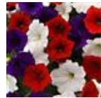
The Flag Mixture