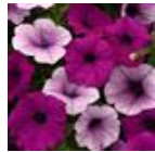
Plum Pudding Mixture