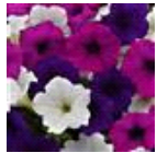
Great Lakes Mixture