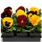
Autumn Blaze Mixture