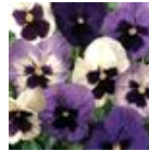
Ocean Breeze Mixture