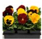
Autumn Blaze Mixture