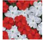
Red White Mixture