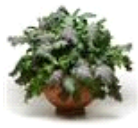
Kale Storm Mixture