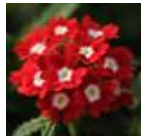
Red with Eye