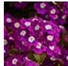
Violet with Eye