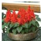
Red Hot Sally II