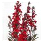
Scarlet Bronze Leaf