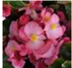
Pink Green Leaf