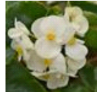
White Green Leaf