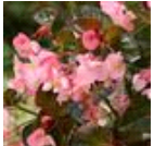
Pink Bronze Leaf