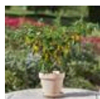
Hot Lemon Zest