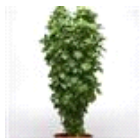
Everleaf Thai Towers