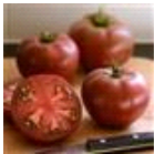
Heirloom Marriage Cherokee Carbon