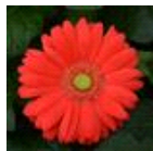
Cherry with Light Eye