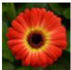
Bicolor Orange Yellow