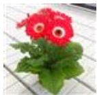
Bicolor Red White