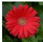
Deep Rose with Light Eye