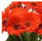
Deep Orange with Dark Eye