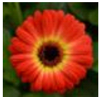
Bicolor Orange Yellow