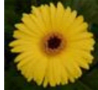
Yellow with Dark Eye