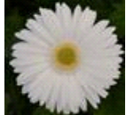
White with Light Eye