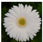
White with Light Eye