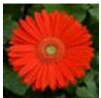
Bright Orange with Light Eye