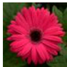
Bright Rose with Dark Eye