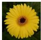
Yellow with Dark Eye