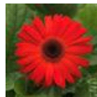
Orange with Dark Eye Improved