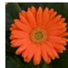
Orange with Light Eye