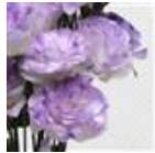
1 Misty Blue