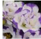
2 Blue Rim