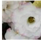
1 Rose Rim