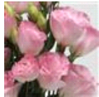
2 Misty Pink