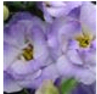
2 Misty Blue