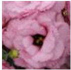
1 Deep Rose