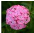
Deep Pink Maxine