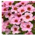
Light Pink Blast