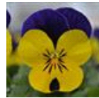
Yellow Violet Jump Up