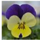
Lemon Jump Up