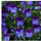
Blue Purple Jump Up