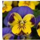
Yellow Blue Jump Up