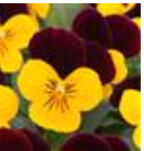
Yellow Burgundy Jump Up