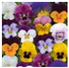
Spring Select Mixture