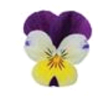
Lemon Jump Up