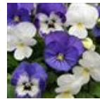
Blueberry Sundae Mixture