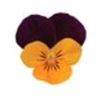
Orange Jump Up