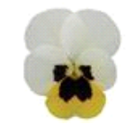
Lemon Ice Blotch