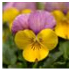
Yellow Pink Jump Up