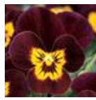
Ruby Gold Babyface