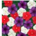
American Pie Mixture