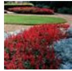
Red Hot Sally II