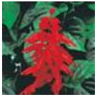
Red Hot Sally II