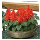
Red Hot Sally II