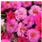
Pink Passion Mixture