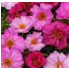
Pink Passion Mixture