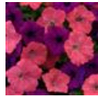
Opposites Attract Mixture