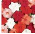
Cha Cha Mixture