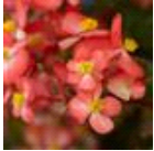
Bicolor Red White